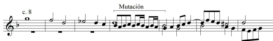
Exemple 7.12. ' Tiento ' de dos tiples de segon to. J. Cabanilles.

El ' Tiento ' de dos tiples de segon to de Cabanilles (Anglés, 1983: IV, 31-39) presenta la construcció típica del tiento partit en l'escola aragonesa: exposició del tema, contraexposició d'aquest, i successió de progressions sobre diversos motius. En aquest cas, el tema és respost amb una mutació ( sol-fa es converteix en re-sib en la resposta):